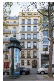
Paris 8 ème – 9, avenue de Friedland © AEW

La performance Globale Annuelle est un nouvel indicateur de performance destiné à améliorer la comparabilité des SCPI. Cet indicateur, qui, dans le cas de FRUCTIPIERRE, additionne sur l'année le taux de distribution et la variation du prix acquéreur moyen, s'établit à 3,22% pour l'année 2025. Elle est nettement supérieure aux taux nationaux calculés pour l'ensemble des SCPI à prépondérance bureaux (-0,3%) et pour l'ensemble des SCPI d'entreprise (1,5%).