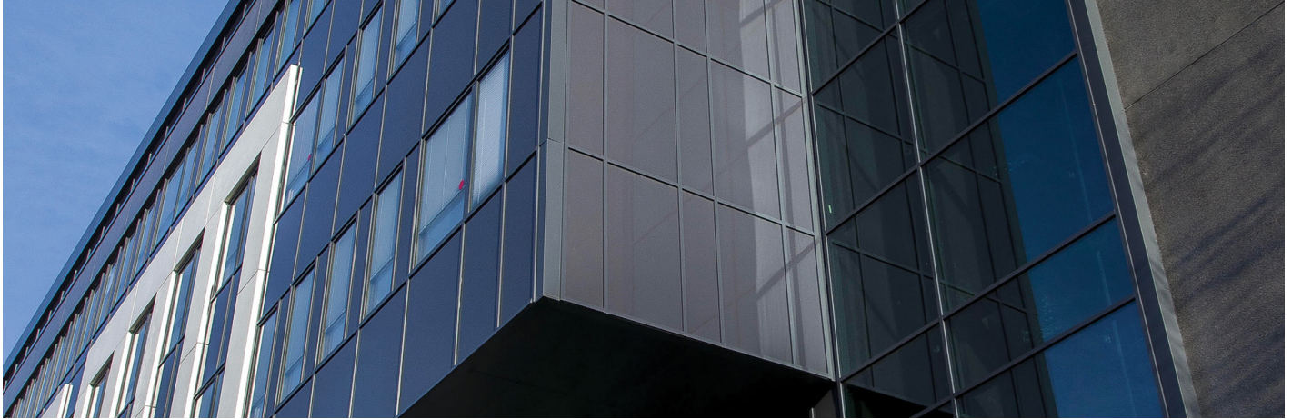
Immeuble Proxima V