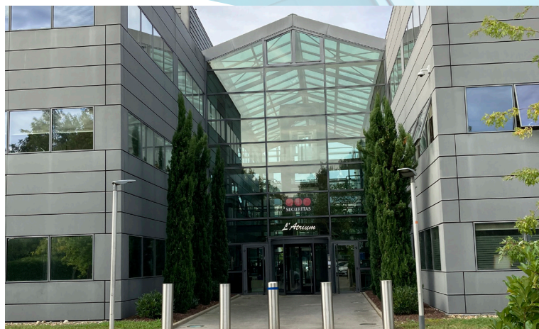
Atrium à Caluire-et Cuire