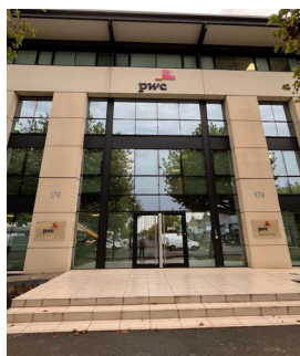
Cours du Médoc à Bordeaux

Lors de ce semestre nous avons mené plusieurs chantiers sur les toitures terrasses d'actifs de la métropole Bordelaise :