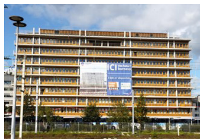
Rennes – Le Solferino

L'immeuble Le Solferino a été acquis en VEFA (en l'état futur d'achèvement) par la SCPI AMR à la fin du 4 ème trimestre 2022 auprès du promoteur immobilier Adim Ouest (groupe Vinci) moyennant un prix de base principal de 31 167 316 € HT. Cet ensemble, a été livré le 12 décembre 2024 et renforce la visibilité de la SCPI AMR sur Rennes au sein d'une zone majeure répondant aux attentes des utilisateurs en quête de centralité.