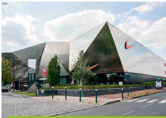
Retail park Enox – Av. du Vieux Chemin St-Denis – Genevilliers (92)

Le retail park Enox est situé dans une zone de chalandise importante, proche de Paris et facilement accessible en transports en commun et en voiture. L'ensemble est entièrement loué à 9 enseignes nationales.