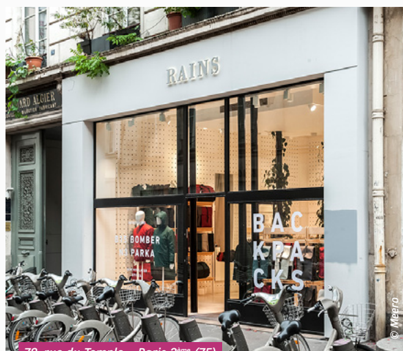
78, rue du Temple – Paris 3 ème (75)

Aucune acquisition ni cession n'a eu lieu au cours du trimestre.