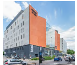
Lyon - Clinique du Parc

AEW reste confiante dans les perspectives du marché immobilier de santé et poursuit ses efforts d'identification d'actifs pour le compte de votre SCPI, afin de constituer un portefeuille cohérent et résilient tourné vers les besoins actuels et futurs du public.