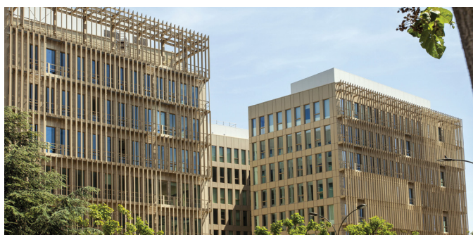
▲ 126-138 avenue de Stalingrad - VILLEJUIF (94)

Il conviendra, pour les associés désirant se porter candidat à un poste de Membre du Conseil de Surveillance et remplissant les conditions ci-dessus énoncées, de faire parvenir à la Société de Gestion avant le 31 mars 2024, un courrier de motivation indiquant leur nom, prénom, âge, le nombre de parts qu'ils possèdent, leurs références professionnelles, la liste de leurs activités au cours des 5 dernières années et de tous les mandats sociaux qu'ils exercent. Des formulaires pour postuler sont disponibles sur notre site Internet.