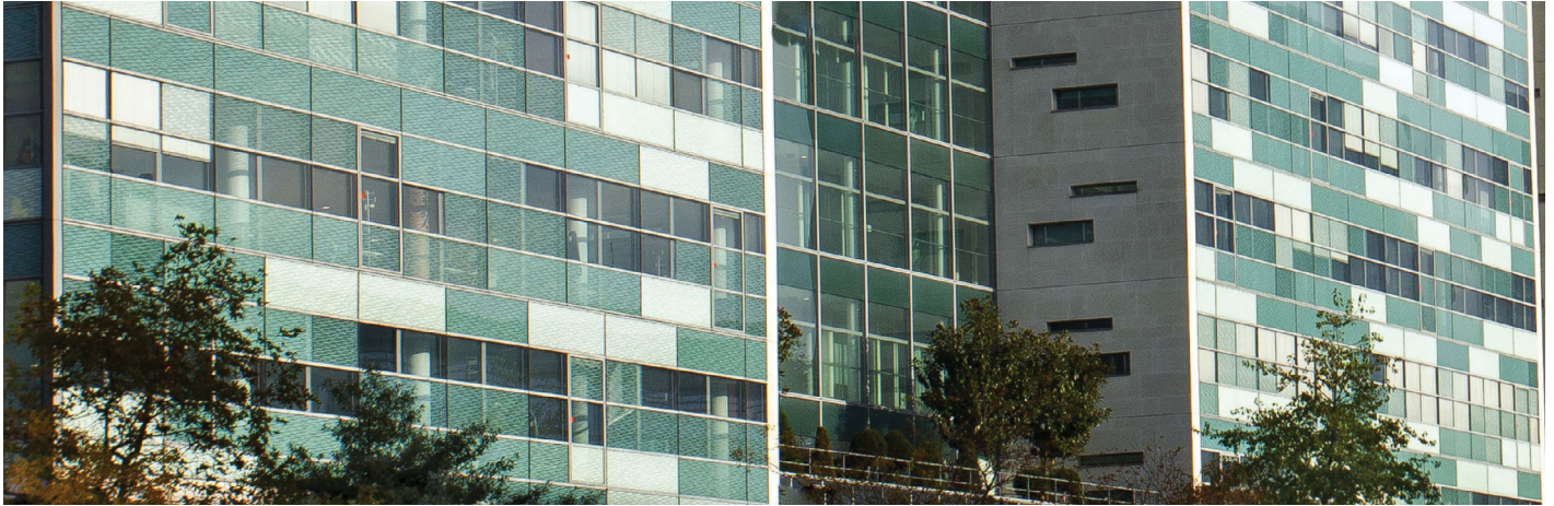
313, Terrasse de l'Arche - 92 Nanterre - Axe 13