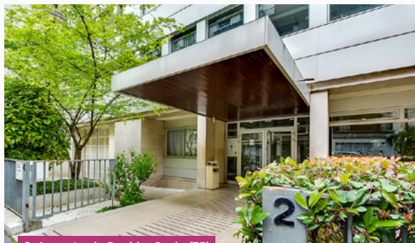
2-4, rue Louis David – Paris (75)