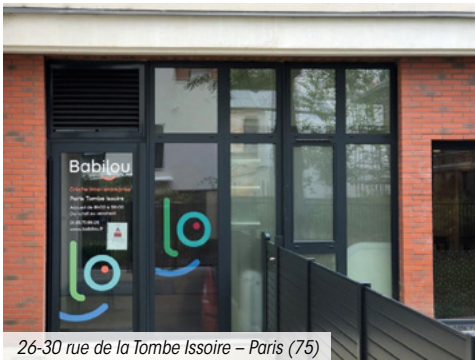
26-30 rue de la Tombe Issoire – Paris (75)