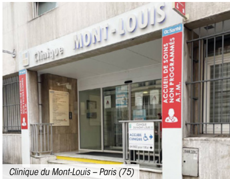
Clinique du Mont-Louis – Paris (75)