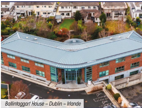
Ballinagart House – Dublin – Irlande

La SCPI n'a enregistré aucun arbitrage ce trimestre.