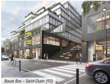
Bauer Box – Saint-Ouen (93)