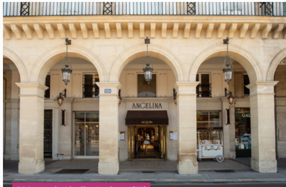
226, rue de Rivoli – Paris 1 er (75)

DOCUMENT D'INFORMATION DU 3 ÈME TRIMESTRE 2023