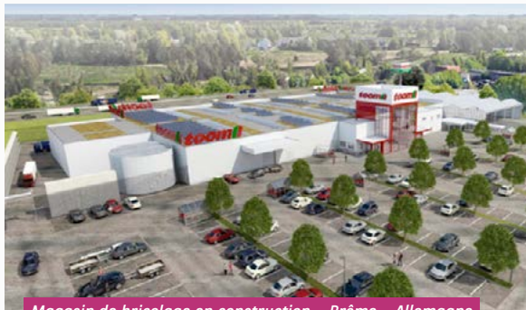
Magasin de bricolage en construction - Brême - Allemagne Livraison prévue au 3 ème trimestre 2023

La distribution aux associés au 1 er semestre 2023 s'établit à 28,02 €/part au total (14,01 €/part sur chacun des 2 premiers trimestres) en ligne avec l'objectif de 3 % de taux de distribution.