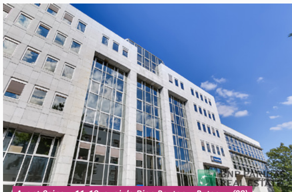
Avant Seine - 11-13, quai de Dion Bouton - Puteaux (92)

Lors du 1 er semestre 2023, votre SCPI France Investipierre a poursuivi sa stratégie de diversification en procédant à des arbitrages ciblés. La vente de l'immeuble « Avant Seine » situé à Puteaux (92), a été réalisée pour un montant de 7,0 M€ hors droits. Par ailleurs, une promesse de vente d'un ensemble immobilier situé au 1-3, cours Albert Thomas à Lyon (69), pour un montant de 9,0 M€ hors droits, a été signée. La réitération devrait intervenir au plus tard en octobre 2023.