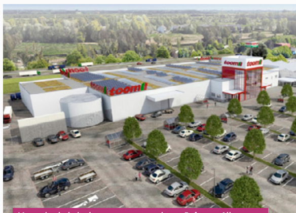
Magasin de bricolage en construction – Brême – Allemagne Livraison prévue au 2 ème trimestre 2023

Votre SCPI étudie actuellement plusieurs opportunités d'investissement qui permettront de consolider la qualité et la diversification du patrimoine.