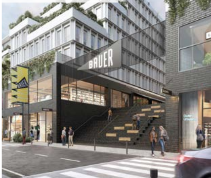
Bauer Box – Saint-Ouen (93)

(3) Pour les non résidents, seuls les immeubles détenus en France sont pris en compte.