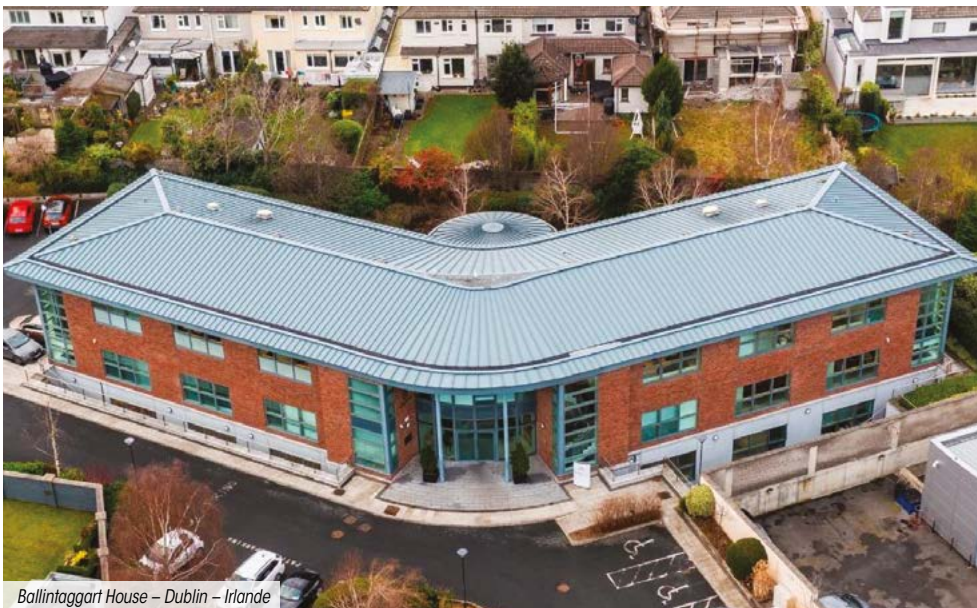
Ballinagart House – Dublin – Irlande