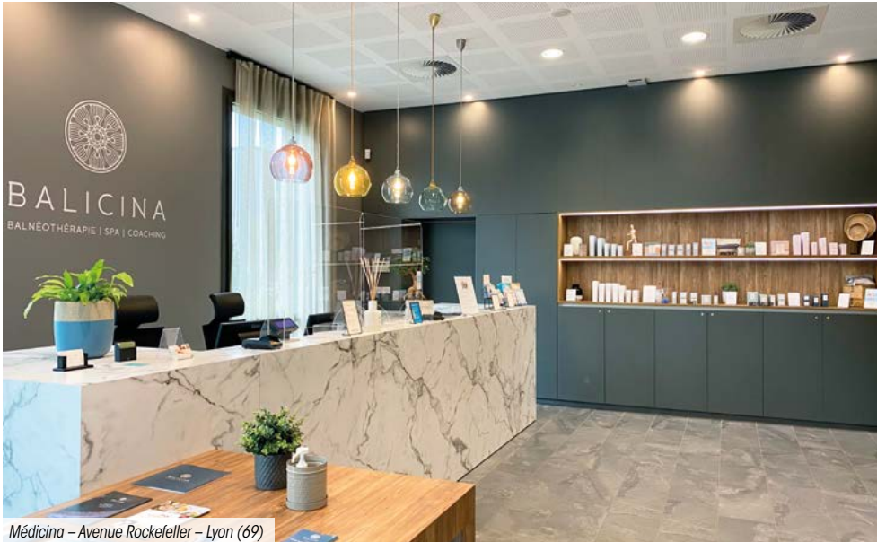
Médecina – Avenue Rockefeller – Lyon (69)

La SCPI n'a enregistré aucun arbitrage ce trimestre.