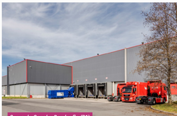
6, rue du Canal – Bondoufle (91)

Au cours du 1 er trimestre de l'année 2023, une signature d'une promesse de vente sur l'immeuble vacant situé au 28, rue d'Arcueil à Gentilly (94) a eu lieu pour un montant de 25 M€ hors droits. La réitération est prévue au plus tard le 2 août 2024.