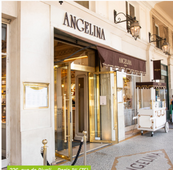
226, rue de Rivoli - Paris 1 er (75)

Le 1 er octobre 2022, BNP Paribas Securities Services (BP2S), banque dépositaire de votre SCPI France Investipierre, a fusionné avec sa société mère BNP Paribas. BNP Paribas devient donc la banque dépositaire de votre SCPI, sans incidence sur les fonctions et opérations mises en place par la société de gestion BNP Paribas Real Estate Investment Management France.