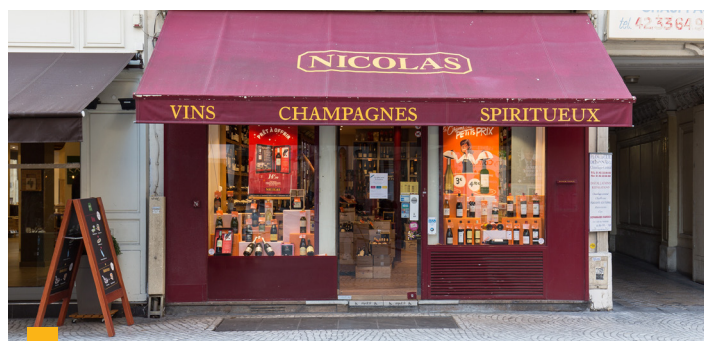
61, rue Montorgueil à Paris (2 ème )

Votre SCPI a engagé la cession de trois actifs difficiles, à Arras (62), Périers (50) et Nogent-le-Rotrou (28). Celui d'Arras a trouvé acquéreur à un prix en ligne avec la valeur d'expertise, générant une plus-value par rapport à la VNC. Pour les deux autres actifs en revanche, des promesses ont été signées à des valeurs dégradées au regard du manque de profondeur de marché sur ces opérations. Pour ces trois actifs, la réitération est prévue au début du 2 nd semestre.