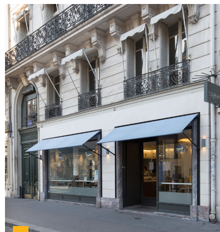
78 Avenue Kléber à Paris (16 ème )

**** Jusqu'à 2020 : TDVM. À partir de 2021 : Taux de distribution.