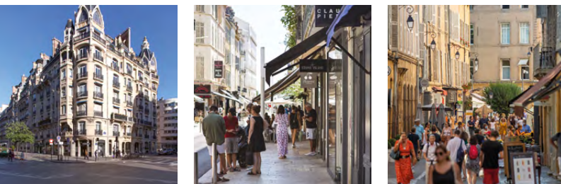
Rue de Courcelles, Paris 17 e