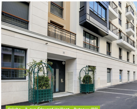
Crèche - 3, rue Édouard Vaillant - Puteaux (92)

Afin de préserver le bon niveau de report à nouveau tout en optimisant la distribution, l'acompte du 3 ème trimestre 2021 est identique à celui du trimestre précédent et s'établit à 3,60 € par part, dont 2,50 € par part provenant du stock de plus-values réalisées au fur et à mesure des arbitrages passés.