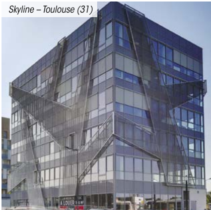
Skyline – Toulouse (31)

*** Pour les non résidents, seuls les immeubles détenus sont pris en compte.