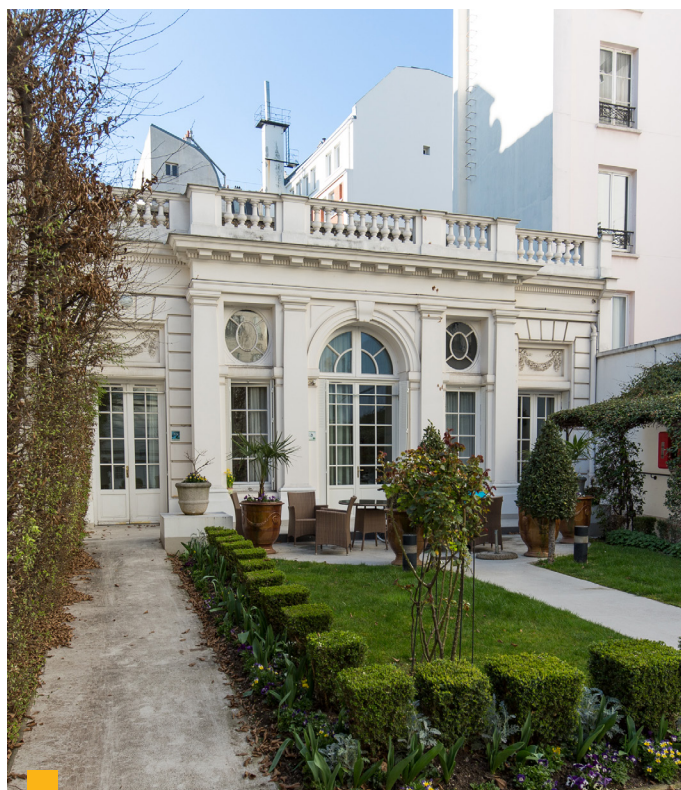
15, rue Boissière à Paris (16 ème )

Depuis la cession des deux immeubles de bureaux Pise et Sienne à Montpellier (34) au premier semestre, votre SCPI n'a pas arbitré de nouvel actif.