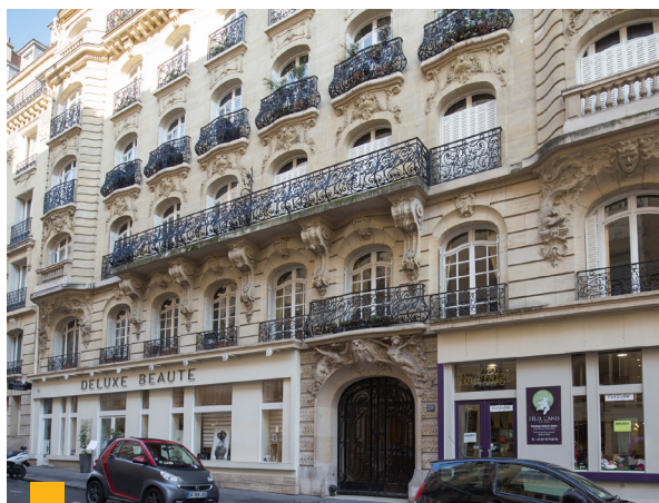
20, rue de Longchamp à Paris (16 ème )