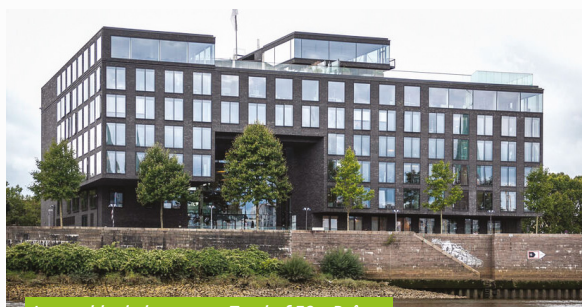
Immeuble de bureaux - Teerhof 59 - Brême